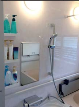
■After 二重窓は一つですがとても明るい