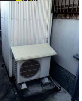
■After エコキュートと室外機を2弾置き設置でスッキリ